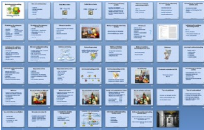
Personalinformation: tumnaglar för alla bilder