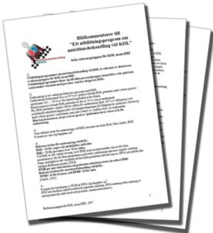
Kommentarer till bildspel