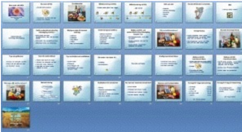
Patientinformation: tumnaglar för alla bilder