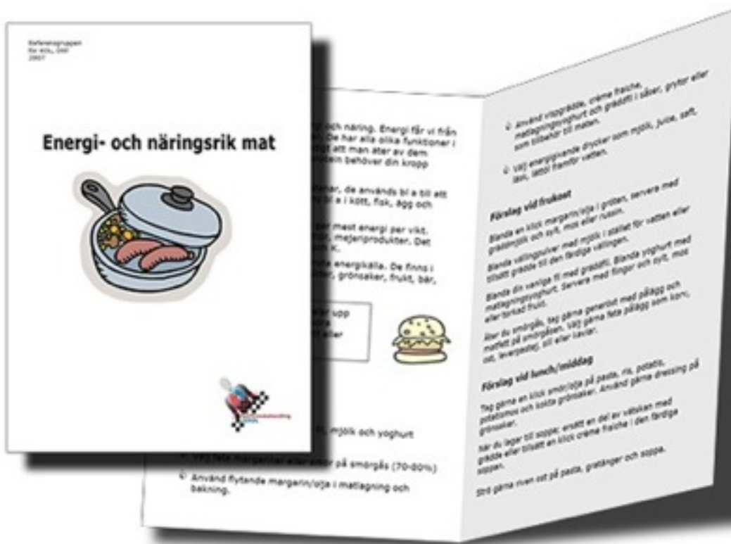
Informationsblad till patienter, både i A4-format och i ett mindre A5-bokviktningensformat