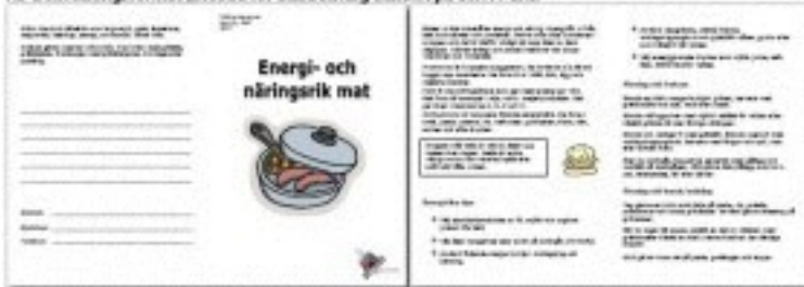
Patientbroschyr: tumnaglar för alla sidor (A4 och A5)