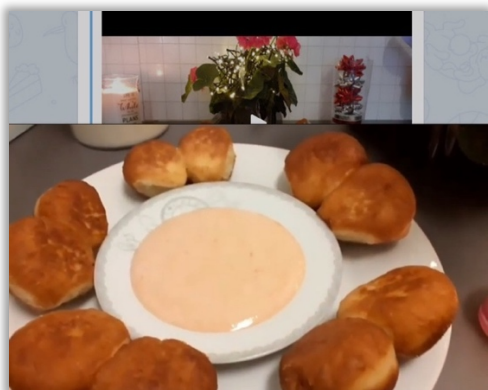
Catumba serverad med sötstark sås