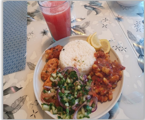
Kebab-fisk, ris, grönsaker, bönor och juice