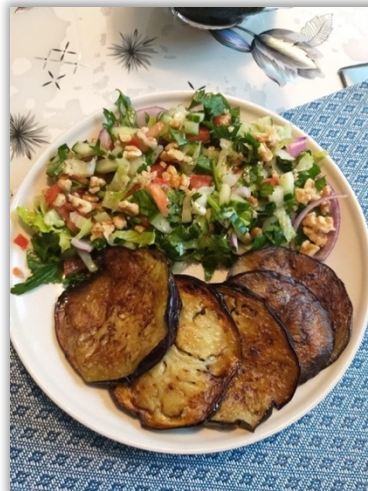
Stekt aubergine och sallad med valnötter