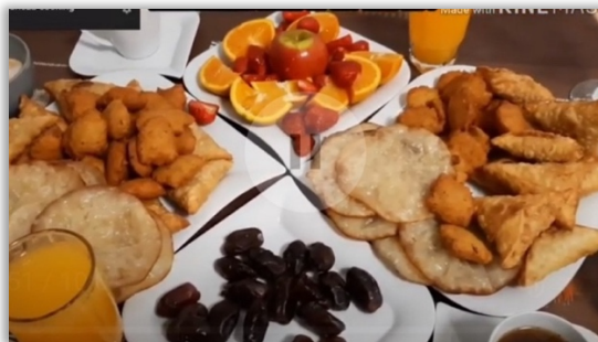
När fastan bryts under ramadan serveras dadlar, sambusa, frukt, kakor, juice mm.