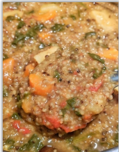
Couscous med grönsaker - i Somalia skulle det istället för couscous ha tillagats med majskorn