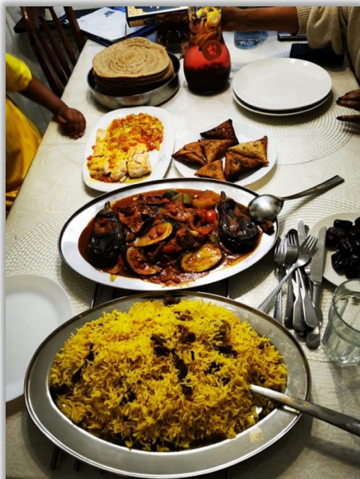
Couscous, spenat, morot, pumpa, paprika, raps- el olivolja. Injera , sambusa , polenta kan serveras med kött kyckling fisk men ej nödvändigt. Vatten, juice eller mjölk till