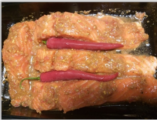
Lax med chili