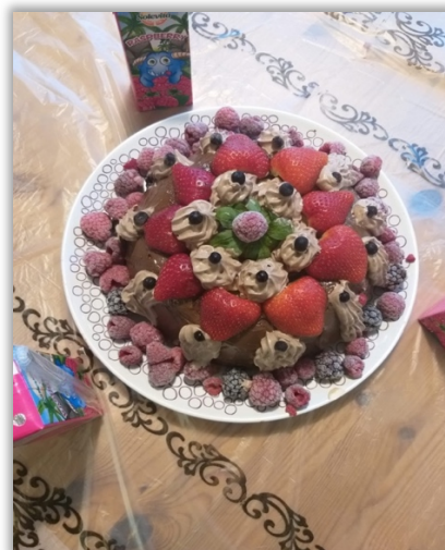
Efterrätt till helgen, lagad tillsammans med barnen: chokladkräm, färska och frysta bär, chokladgräde