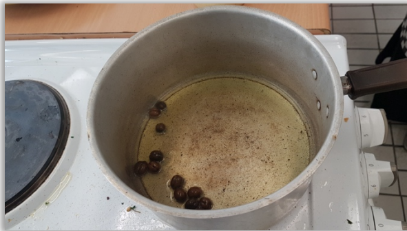
Kaffeböner steks i olja