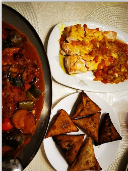
Jimco : Röda bönor/svarta linser + olja och ugnstostade kaffebönor. Sambusa . Äts på fredagar med familj och släkt. Somaliskt kaffe till (eller getmjölk i hemlandet)