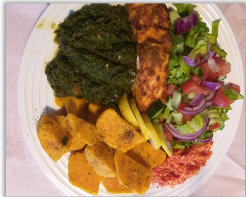
Ugnstekta lax, potatis, grönsaker