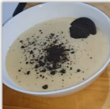
Custard med oreo-kakor