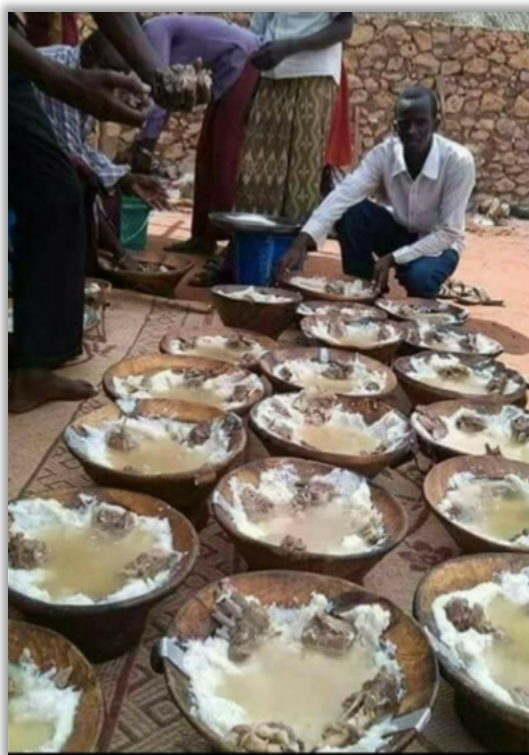
Traditionell lunch med majs, soppa och get- eller kamelkött