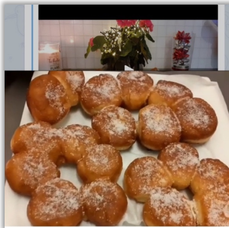
Catumba – bakverk som liknar “doughnut”