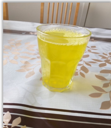
Juice - färskpressad