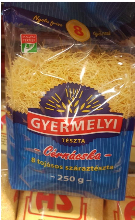
Pasta, för mat- och efterrätt