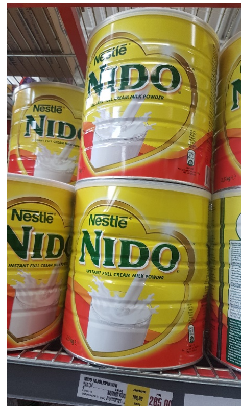
Nido, mjölkpulver att blanda med vatten