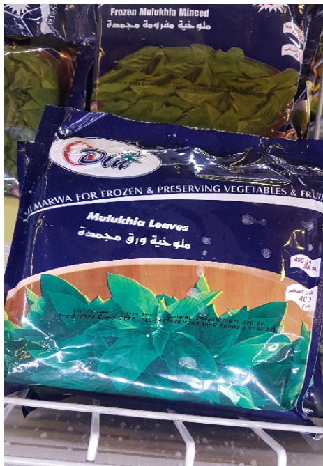
Molokhia, gröna blad, frusen