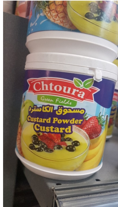
Custard - efterrätt