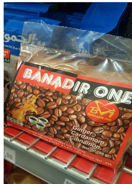
Kryddblandning till somaliskt kaffe