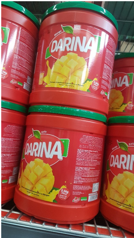
Saft – pulver att blanda med vatten