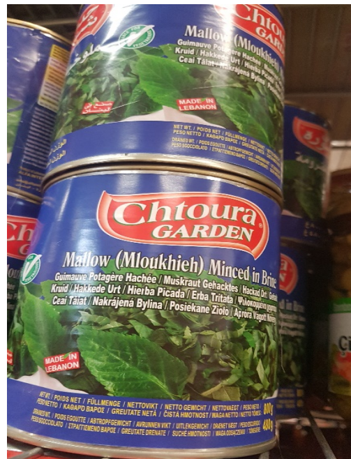
Molokhia, gröna blad, konserverade