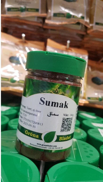
Sumak, pulver av torkade bär