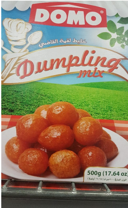
Dumpling - efterrätt