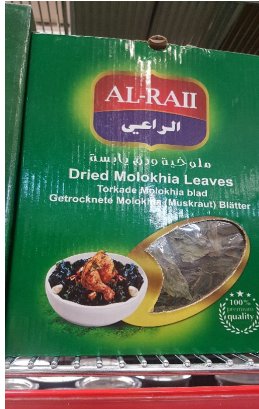
Molokhia, gröna blad, torkade