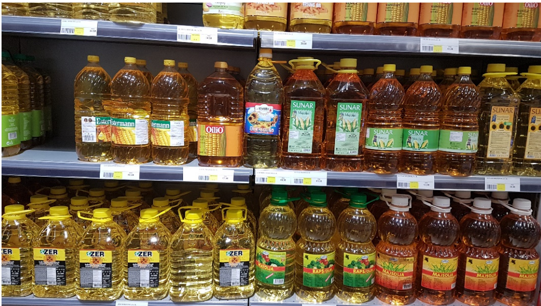
Olja, div sorter