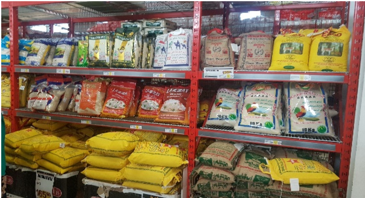
Ris, olika sorter